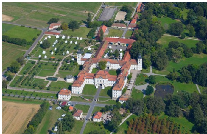
Schloss Fasanerie Eichenzell

Sieben Kilometer südlich von Fulda liegt auf einer leichten Anhöhe, umrahmt von herrlichen Waldungen und fruchtbaren Feldern, Hessens schönstes Barockschloss. Dem Terrain der sanft abfallenden Hügel harmonisch angepasst, wurde die reizvolle Lage vom Bauherrn und seinem Architekten mit viel Einfühlungsvermögen genutzt. Die Anlage vermittelt dem heutigen Besucher in einem gelungenem Zusammenspiel von Park, und Schlossgebäuden den Eindruck einer fürstlichen Sommerresidenz der vergangenen Jahrhunderte. Dazu gehören repräsentative Schlossflügel ebenso wie schlichte Wirtschaftsgebäude; verspielte Parkpavillons ebenso wie Pferdestallungen.